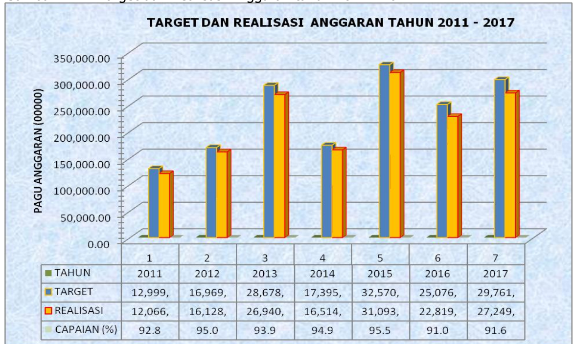
Gambar. 12 . Target dan Realisasi Anggaran tahun 2011 - 2017

Sumber : Laporan Realisasi Anggaran Per Belanja BPTP NTT TA. 2011-2017